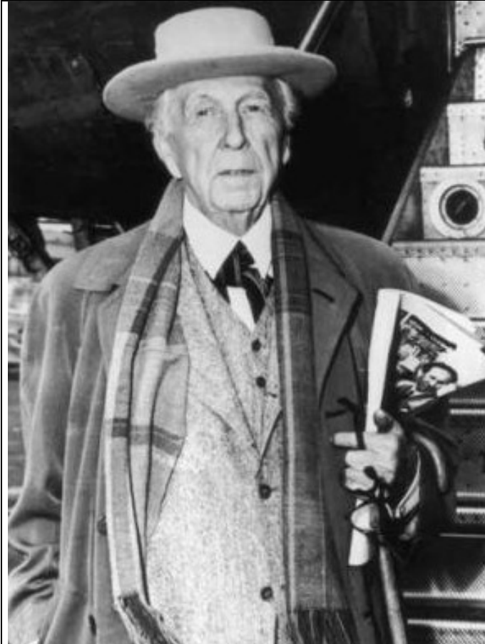
Der Architekt Frank Lloyd Wright 1867-1959

Im Rahmen unserer Veranstaltungsreihe „Architekturfilm und Jazz“ im Thalia Kino am Obstmarkt in Augsburg bringen wir am Montag den 6. Februar 2012 - 19:00 einen Film über den Architekten Frank Lloyd Wright (Eintritt 5 €). Nach dem Film gibt es Live-Jazz im Kaffeehaus im Thalia mit dem Jazz-Trio „We remember Chet“ bei gutem Essen, guten Gesprächen und bei freiem Eintritt (Verzehr muss bezahlt werden)!