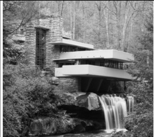
Falling Water 1937